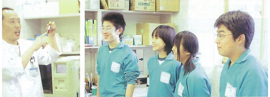
▼ 臨床検査技師の説明を熱心に聞く東中学の生徒さん達

当院にも吉川市の中学生が職場体験学習に来ています。平成17年2月1日～3日まで東中学校の生徒さん4名が来られ、職員、患者様とふれあい、病院の仕事を体験してもらいました。当院の体験内容は看護師、検査技師、放射線技師、薬剤師、栄養士、理学療法士、などそれぞれの専門職から仕事内容の説明をして、院内全体を見学してもらいます。病棟では、看護業務と一緒に体験し、可愛い4人に患者様も大喜びで、働く楽しさを体験できたのではないのでしょうか。これからも医療専門職に興味のある中学生の皆さんお待ちしていますよ。