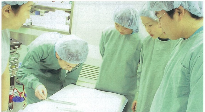
▲ 緊張の手術室体験