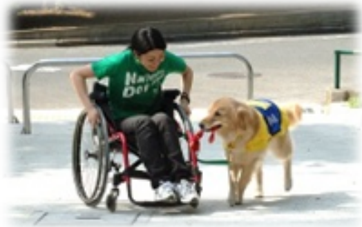
社会福祉法人 日本介助犬協会提供