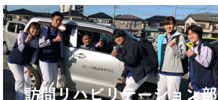
訪問リハビリテーションチーム