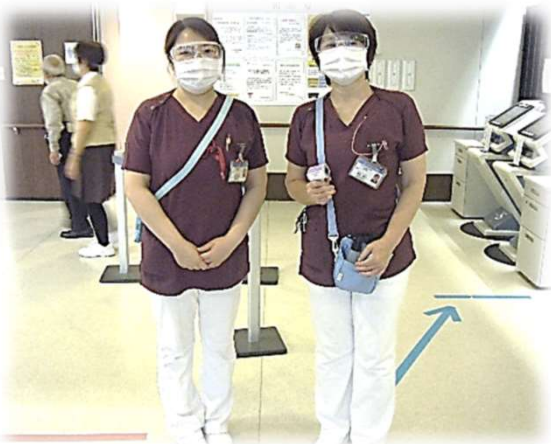
病院入口でのトリアージ

当院では新型コロナウイルス感染防止の対策として このような活動を実施しています。