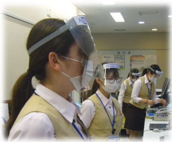
フェイスシールド・ゴーグルの着用