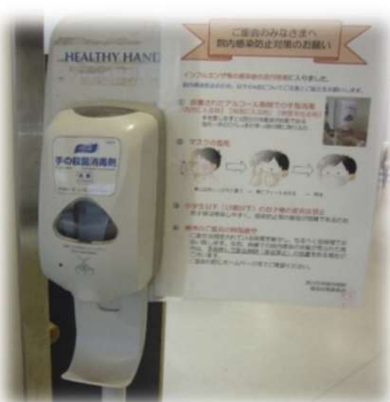
手指消毒液の設置