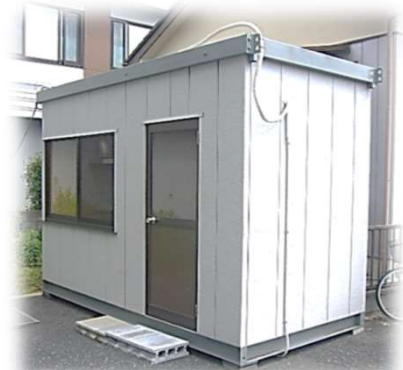
院外発熱者待機所