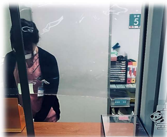
ビニールシートの活用