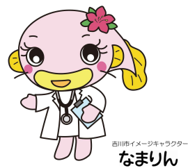
吉川市イメージキャラクター なまりん