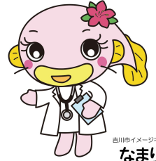
吉川市イメージキャラクター なまりん