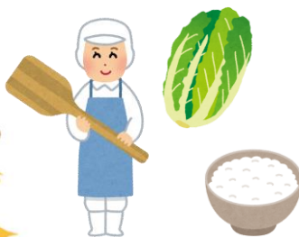
2023年度 全国栄養改善大

このたび特定給食施設として厚生労働大臣表彰をいただきました。今後も給食委託エムティーフードと協力して安全で美味しく、患者様個々の治療にあわせたお食事の提供に努めていきます。